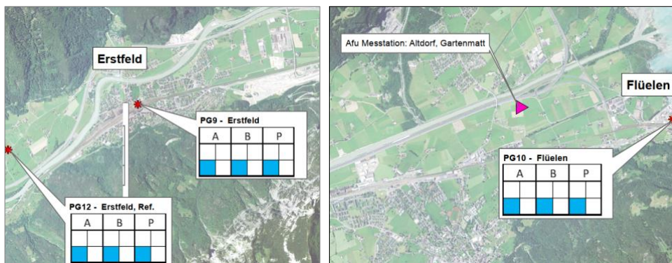
Abb. 2: Lage der Messstellen der Luftqualität in Erstfeld und Flüelen mit Messungen vor Baubeginn, während der Bauphase und nach Bauende (A, B resp. P)